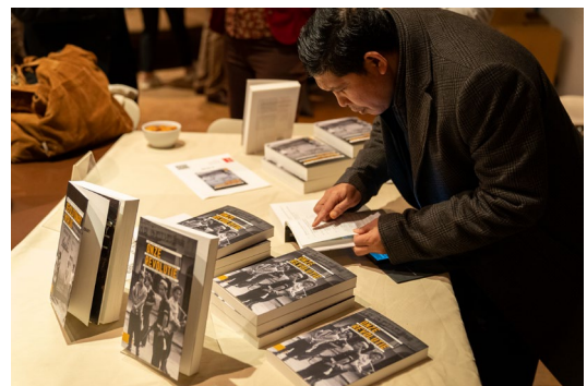
Boekpresentatie over de Indonesische Revolutie

Op 2 februari werden in Museum Volkenkunde in Leiden twee boeken gepresenteerd: Revolutionary Worlds: Local Perspectives and Dynamics during the Indonesian Independence War, 1945-1949 en Onze Revolutie. Bloemlezing uit de Indonesische geschiedschrijving over de strijd voor de onafhankelijkheid, 1945-1949 . De boeken komen voort uit het onderzoeksprogramma 'Onafhankelijkheid, dekolonisatie, geweld en oorlog in Indonesië, 1945-1950'.