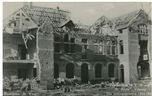
Psychiatrische inrichting St Anna, Venray na oorlogsgeweld