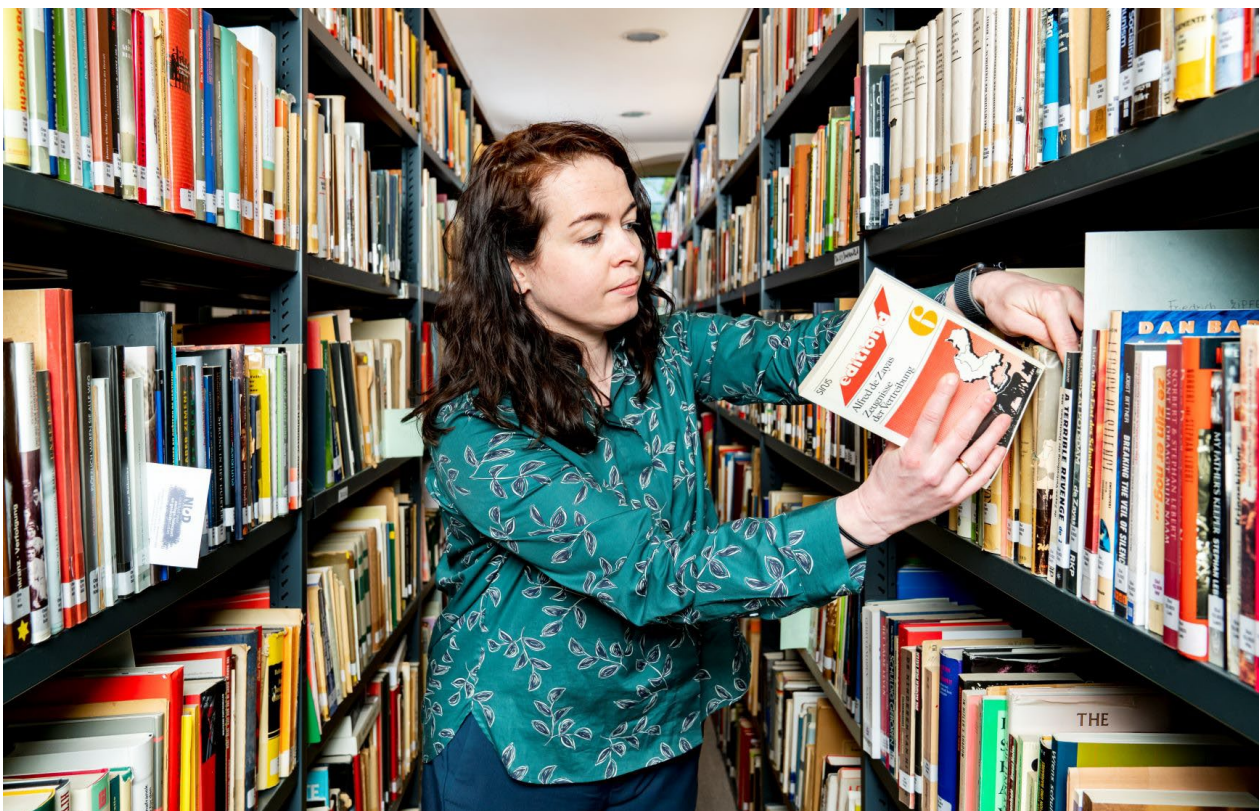
De bibliotheek

Een ander hoogtepunt in 2023 was de ingebruikname van het digitale depot in december 2023. In samenwerking met de afdeling Digitale Infrastructuur van het Humanities Cluster van de KNAW zijn de eerste gedigitaliseerde collecties in die maand opgeslagen in het digitale depot.