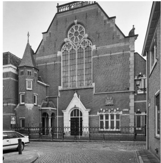
Synagoge te Zwolle