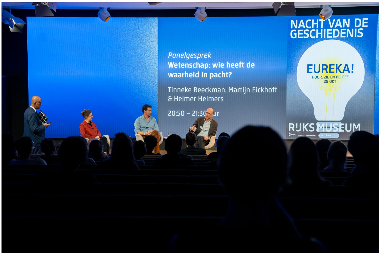
Nacht van de Geschiedenis

Op 28 oktober werd tijdens de Nacht van de Geschiedenis in het Rijksmuseum de Maand van de Geschiedenis afgesloten. Het thema van dit jaar was 'Eureka!'. Namens het NIOD leverden Martijn Eickhoff, Remco Ensel en Kees Ribbens een bijdrage aan het programma.