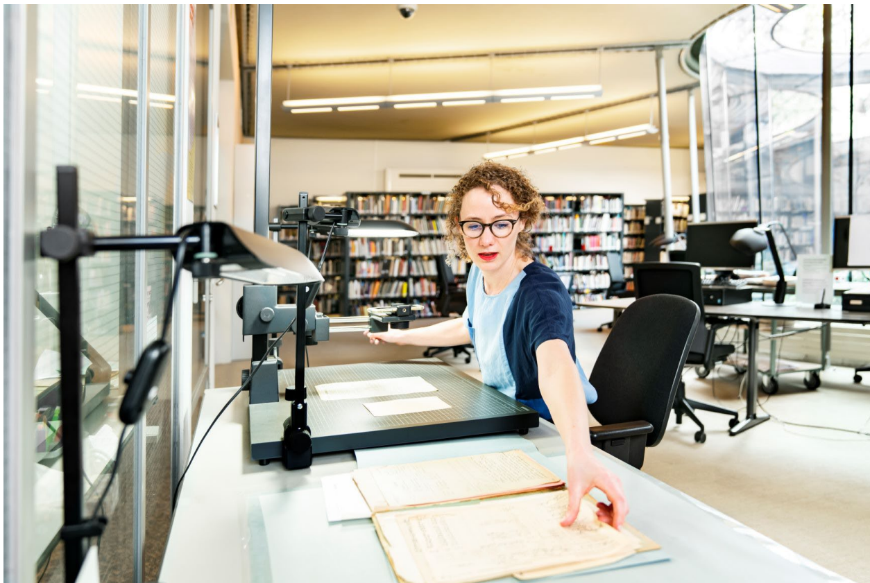
De studiezaal

De afdeling Collecties en Diensten werkt aan het beheren en toegankelijk maken van de collecties van het NIOD. Hieronder vallen de fysieke, digitale en gedigitaliseerde collecties: archief, bibliotheek en beeldmateriaal.