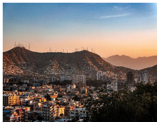
Kabul, Afghanistan