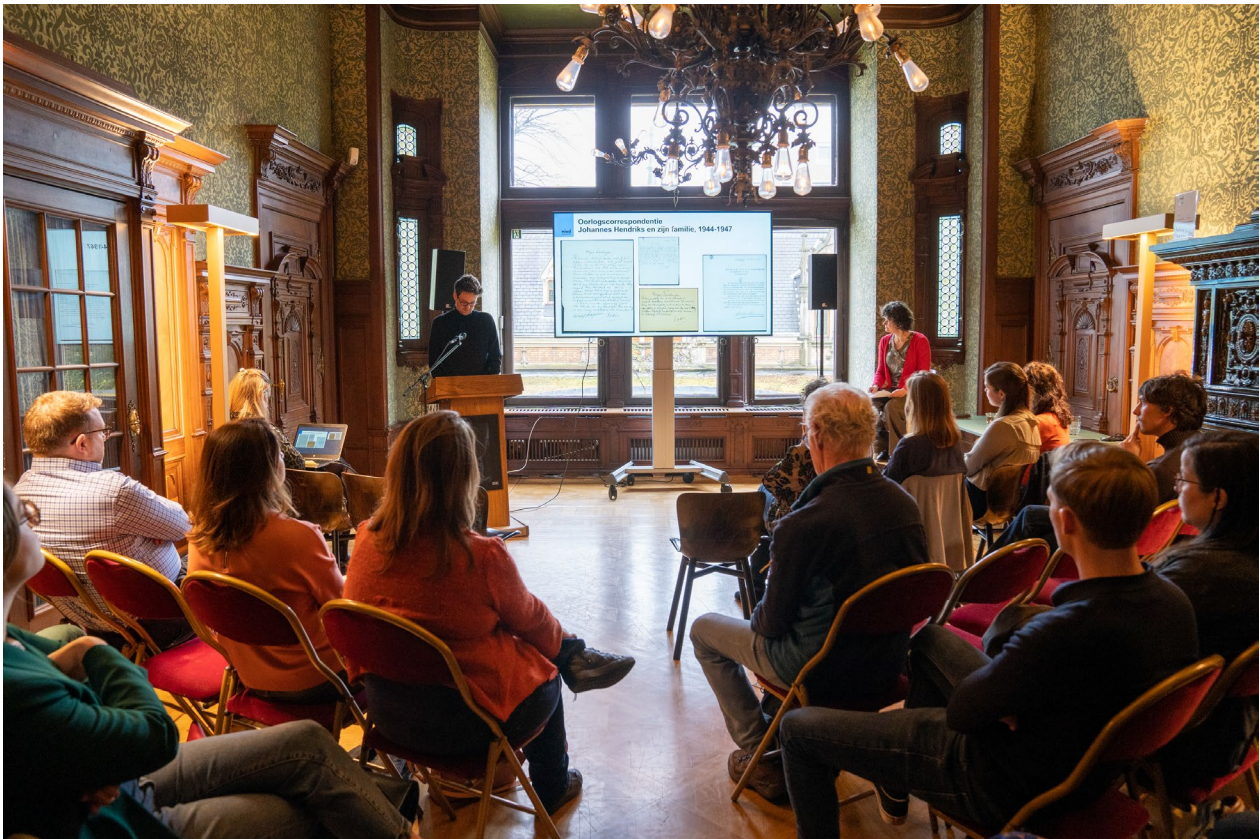
Campagneweek Postbus NIOD