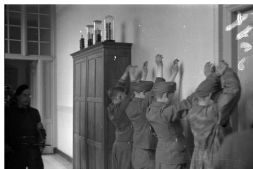
Krijgsgevangenen Duitsers in het Laboratorium voor Technische Botanie, Delft, 6 mei 1945