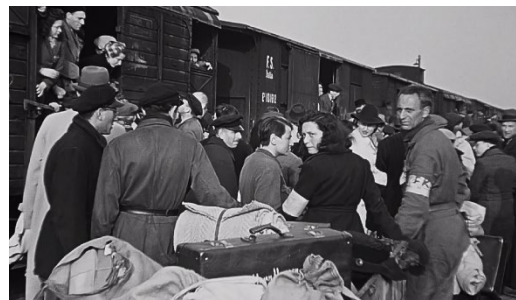
Still van het perron in Kamp Westerbork, Westerborkfilm, 1944

Onderzoek naar Nederlandse wetenschapsbeoefening in de schaduw van oorlog en onderdrukking.