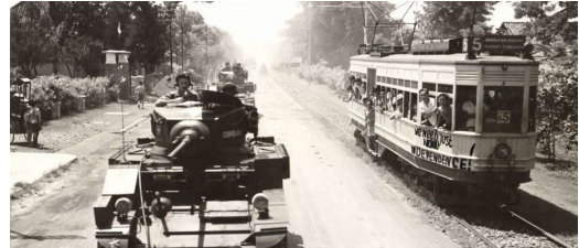
Britse tanks in Jakarta, 29 oktober 1945, foto-graaf onbekend - NIOD

Onderzoek naar betekenis van de Duitse bezetting voor psychiatrische instellingen en instellingen voor mensen met een verstandelijke beperking.