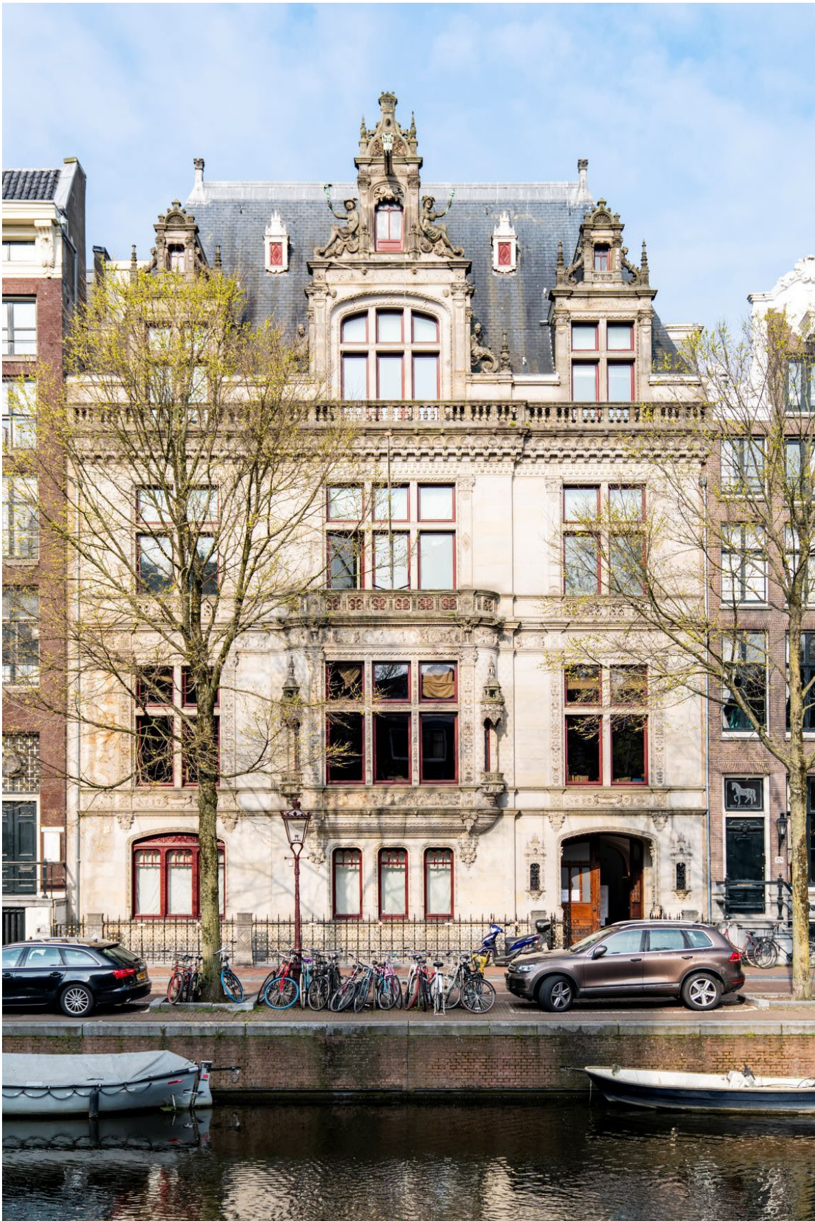
Herengracht 38o, foto Joke Schut